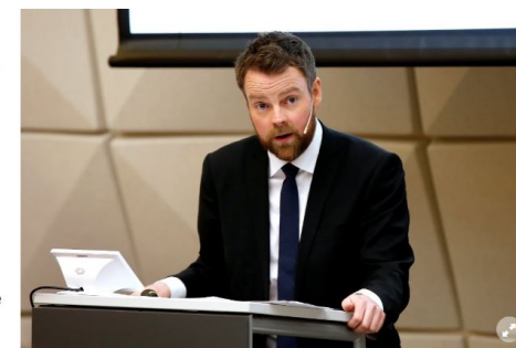
Kunnskapsminister Torbjørn Røe Isaksen presenterer stortingsmeldingen om fornyelse av skolefagene.

Regjeringen foreslår her å beholde dagens skolefag, men vil slanke flere av dem ettersom det stadig er tatt inn nye temaer uten at noe er fjernet. Hvilke temaer som skal ut, er ikke klart.